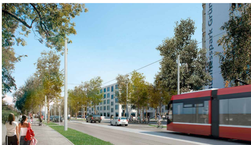
Der Raum Kleinwabern gewinnt stark an Bedeutung. Die Grünen wollen diese Entwicklung mit einer kostenbewussten Verkehrserschliessung nachhaltig sichern.

Die Fraktionen der Grünen und der Mitte (GLP, EVP und CVP) fordern deshalb den Gemeinderat mit einem Vorstoss auf, kostengünstigere Varianten für die Tramlinienverlängerung auszuarbeiten. Allen voran sollen Alternativen geprüft werden zur geplanten, sehr teuren Wendschleife, die von den neu entdeckten archäologischen Fundstellen im Balsigergut nicht tangiert werden und die losgelöst sind vom Bau einer zusätzlichen S-Bahn-Haltestelle. Mit dieser Variantenprüfung wollen die Grünen sicherstellen, dass der Volkswille umgesetzt werden kann und eine kostenbewusste Verkehrserschliessung die Entwicklung des Gebiets Kleinwabern nachhaltig sichert.