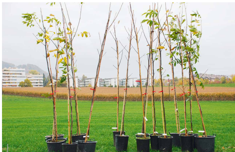
Junge Bäume, bereit zum Anpflanzen – ein Beitrag zur Erhaltung des Kulturlandes am Siedlungsrand

Wir beide haben uns entschieden, unsere Ideen in einer Jungpartei einzubringen, weil es uns motiviert, in einer Gruppe gemeinsam Pläne für eine umwelt- und menschenfreundliche Zukunft umzusetzen. So sind wir zum Beispiel mit dabei gewesen,